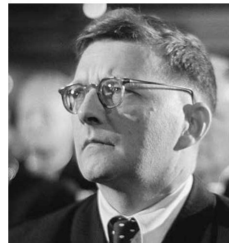
Dmitri Schostakowitsch 1950 im Publikum des Bachfests.

In der Zeit des sogenannten «Tauwetters» nach dem Tod von Stalin, in der seine Verbrechen offen kritisiert wurden, atmeten