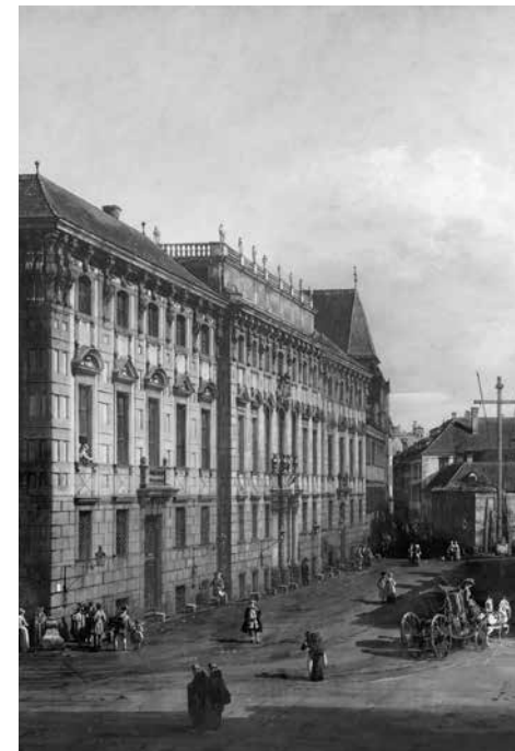
Das Palais Lobkowitz (links) in Wien (Quelle: Kunsthistorisches Museum Wien, Bilddatenbank).