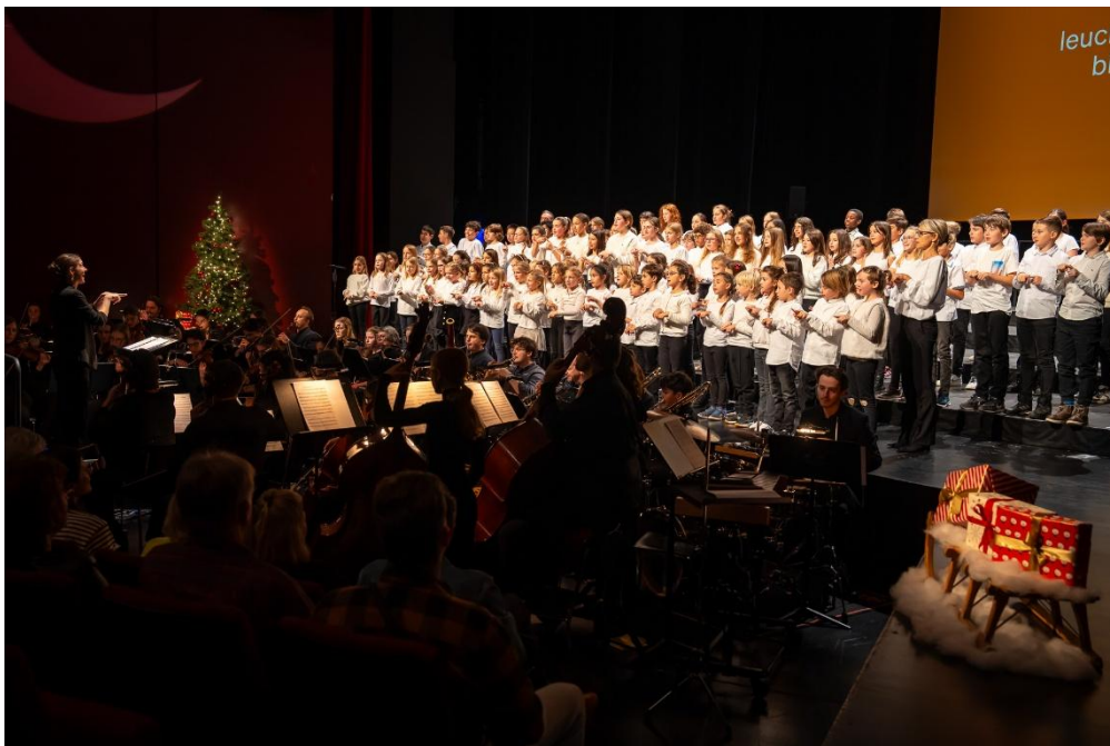
Weihnachtszauber 2024

Die angemeldeten Schulklassen kommen am Donnerstag, 10.12.2026, am Vormittag für eine der beiden Generalproben in das Theater Casino Zug (vgl. Daten). Hier treffen sie erstmals auf das ganze Orchester sowie auf andere angemeldete Schulklassen und den Kinderchor. Es folgen eine Schulaufführung und zwei öffentliche Aufführungen, an denen die verschiedenen Schulklassen gemeinsam das Programm präsentieren. Für Verpflegung an den Generalproben und Konzerten ist gesorgt.