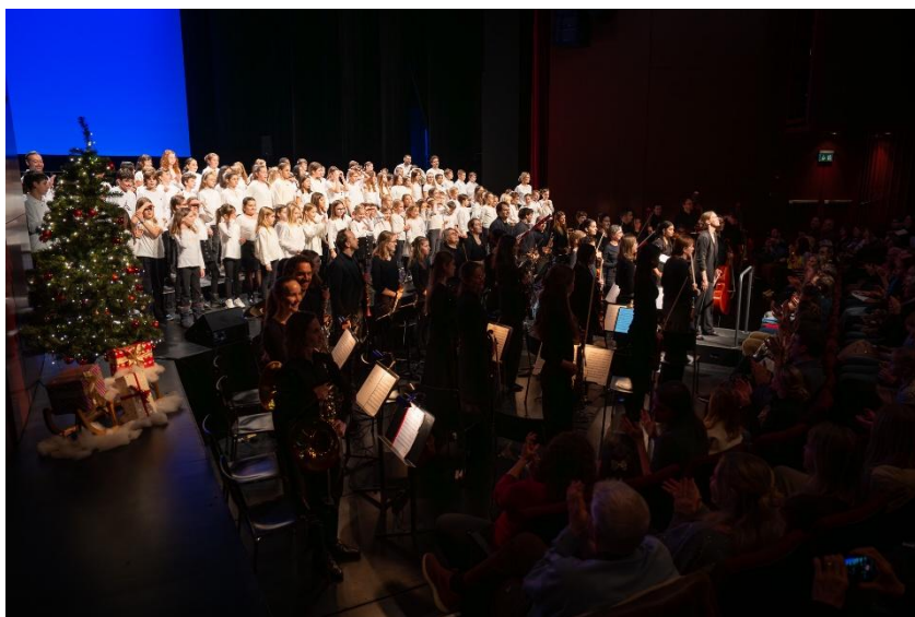
Weihnachtszauber 2024

Die genannten Unterlagen stehen vor den Sommerferien auf der Website der Zuger Sinfonietta zur Verfügung.