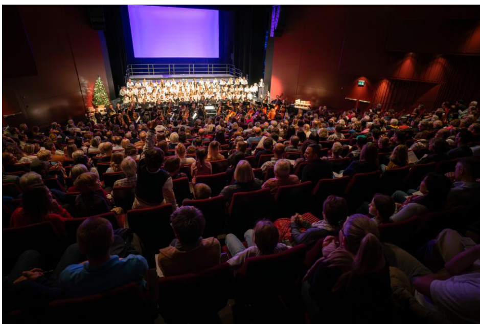
Weihnachtszauber 2024

Mit diesem Projekt schreibt die Zuger Sinfonietta die Tradition des Weihnachtssingens fort. Solche hatten in Zug schon früher über Jahre hinweg stattgefunden – die Zuger Sinfonietta hat die Tradition wiederaufgenommen, indem sie bereits 2024 mit grossem Erfolg einen «Weihnachtszauber» durchgeführt hat.