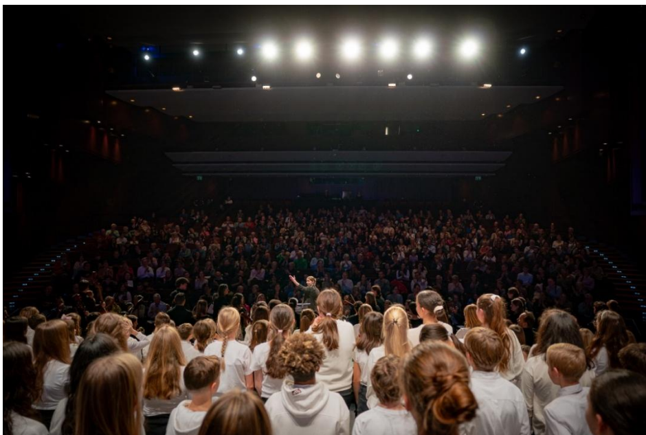
Weihnachtszauber 2024