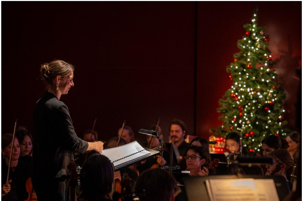
Weihnachtszauber 2024

Die genannten Unterlagen stehen vor den Sommerferien auf der Website der Zuger Sinfonietta zur Verfügung.