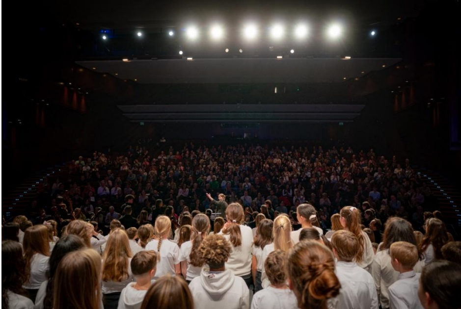
Weihnachtszauber 2024