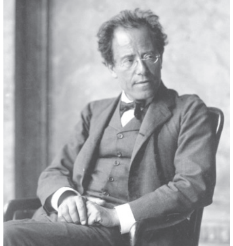
Gustav Mahler 1907 im Foyer der Wiener Staatsoper

Die «Blumine»-Musik ist durchaus programmatisch gemeint. Im Rahmen der Schauspielmusik illustriert sie die «Mondnacht», in der Werner, die Hauptfigur des Theaterstücks, mit seiner Trompete an den Gestaden des Rheins ein Ständchen für seine geliebte Margareta spielt. In der Frühfassung der 1. Sinfonie war der Satz wiederum als «Liebesepisode» betitelt. Passend zur Thematik hat die Trompete in den